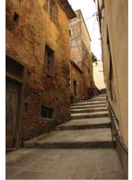
Castiglione Fiorentinon vanhan kaupungin kapeilta kujilta löytyy mielenkiintoisia maalauskohteita.