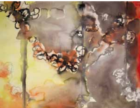
Varjo II, 55x75cm, akvarelli 2012.