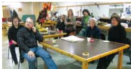
Akvarelliryhmä kokoontuu Kerhotalo Sasekalle lauantaisin aamupäivällä.