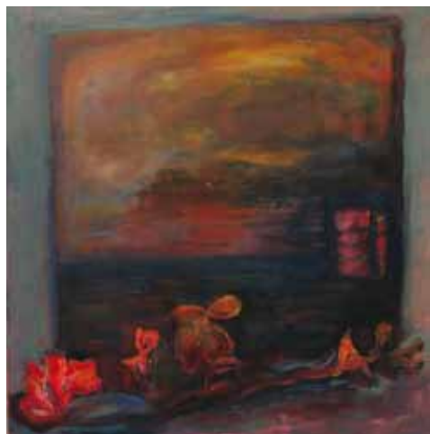
Maila Niskanen-Kopio: Rannalle kasvaneet, öljy.