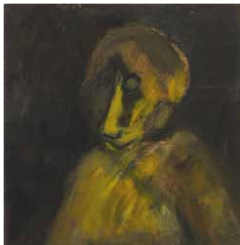
Ilona Sevelius: Faaraon paviaani, öljy.