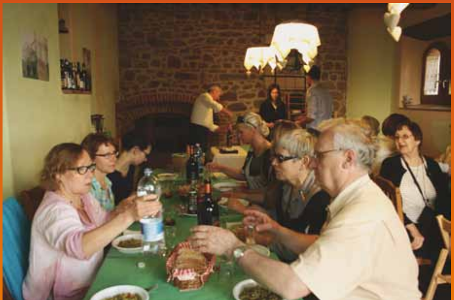
Castiglion Fiorentino, Toscana 30.5.–5.6.2012.