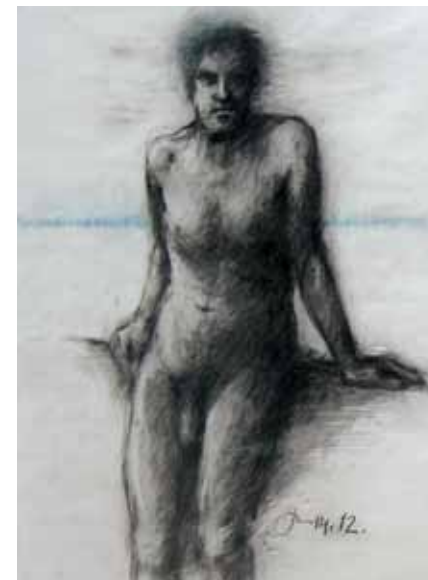
Pekka Martin: Vapaus, hiili.