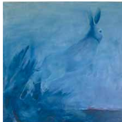
Minna Enäjärvi: Jänis, öljy.