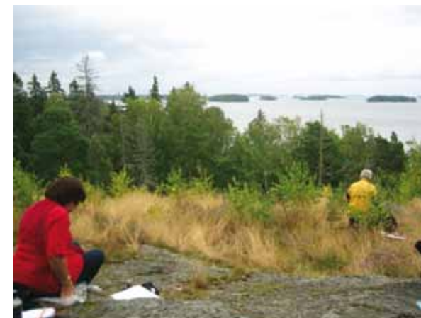
Tehtävänä on meren sävyt.

Yhtenä iltapäivänä tutkimme värien ja valon muuttumista Viikinkikalliolta merelle tuijottaen. Kokemus oli minulle uusi ja värisyttävä. Meidän piti maalata neljä kuvaa samasta rajatusta kohdasta tunnin välein. Ja silloin oli pilvistä! Meri oli milloin harmaa tai vihreään tai violettiin taivuttava, mutta silti pensseli hakeutui sinisiin värinappeihin. Ja vähän hullusti se meni niiden metsäisten saartenkin kanssa. Mielenkiintoisin tapahtui myöhemmin Kartanolla, maalasimme vielä kerran maiseman ulkomuistista – ja löy-