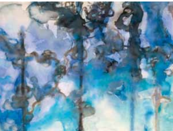
Varjo III, 55 x 75cm, akvarelli 2012.

relli- ja akryylimaalauksia. Öljyväreillä työskentely on nyt jäänyt vähäisemmäksi, koska minulle tuli maalaus kriisi materiaalin kanssa noin 3 vuotta sitten. En saanut maalauksiani valmiiksi. Siksi vaihdoin välineitä akryyliin ja siirtymä oli mielestäni helppo, kun oli vahva akvarellipohja.