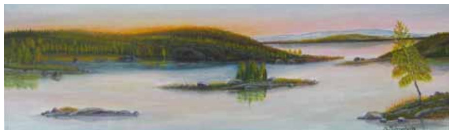
Seppo Saloranta: Järvimaisema jostain sieltä, öljy.