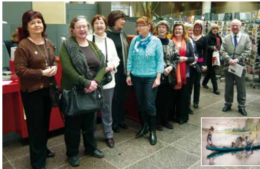
Carl Larssonin Hyvän elämän jäljillä -näyttelyä katsomassa Ateneumissa 24.3.2012.