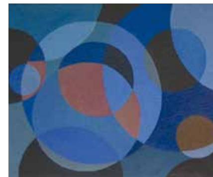
Anni Sovala: Sininen hetki, öljy.