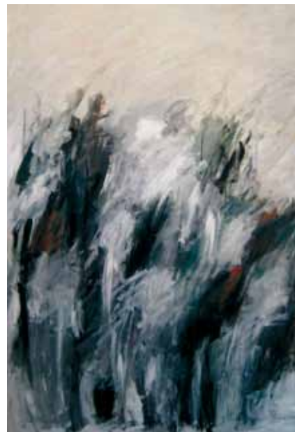
Ulla Vapaavuori: Talvi, öljy.