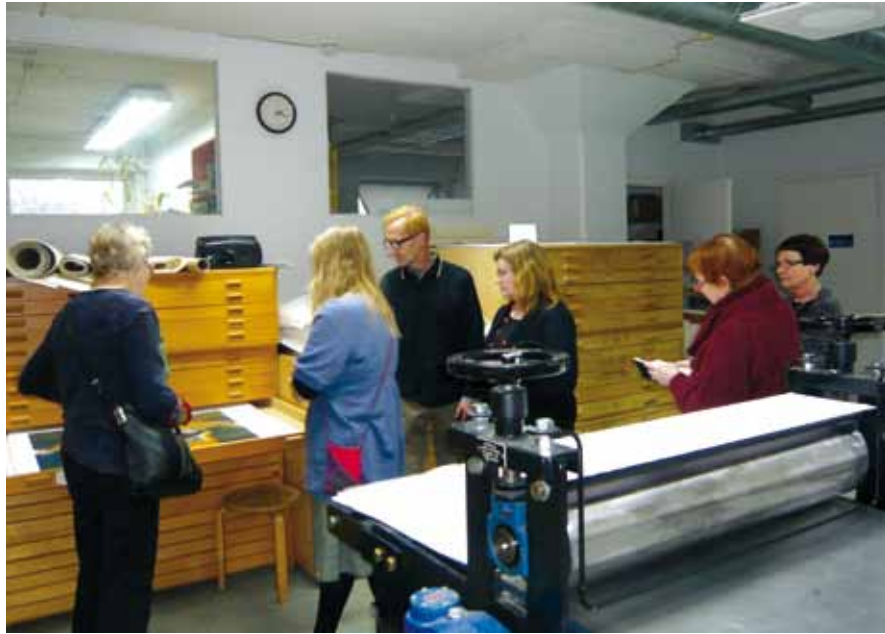
Vierailu Arabian taidegraafikoiden työhuoneelle 21.1.2012