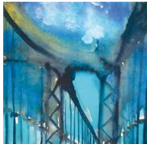
Sillalla 30 x 30 cm akvarelli 2012.

Olet aikaisemmin opettanut Itä-Helsingin