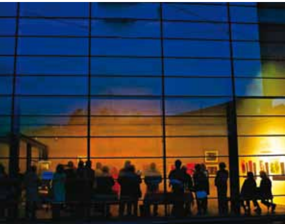
Kuvat Andy Wall