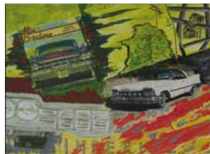
Alexey Paramonov: Volyme 4, akryyli.