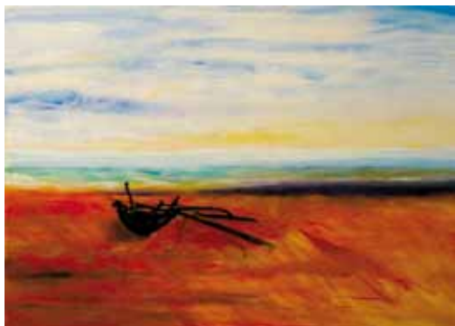
Ritva Juselius: Negobon rannalla I, öljy.