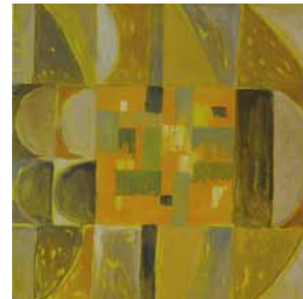
Eeva Korjula: Apupalu, öljy.