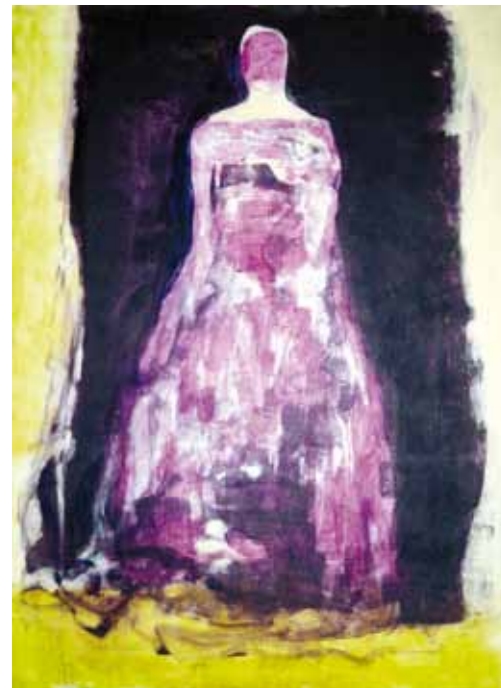
Vanha tapuli, 120 x 90 cm, akryyli kankaalle 2011.

gin Taideseurassa elävän mallin piirustusta. Nykyisin olet opettajana torstain työpajassa ja lauantain akvarelli-ryhmässä. Opetatko muualla?