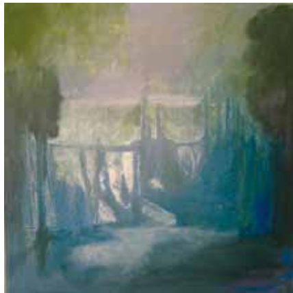
Mau Salmi: Aamu 1, öljy. Tunnustuspalkinto.

Nykyään löytyy monenlaisia massoja, joilla voi jatkaa kerrosmaalauksen värejä ja saada kohokuvioita töihin. Tätkin tekniikkaa oli mukana näyttelyssä.